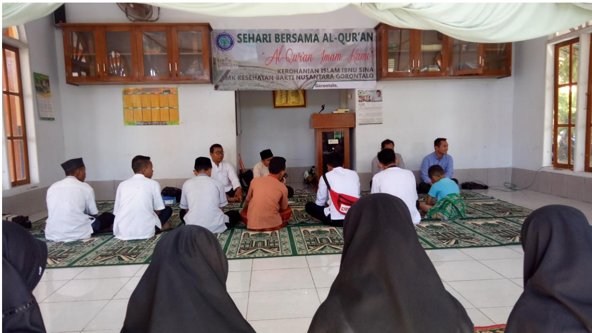
KEGIATAN KOLABORASI OSIS DAN ROHIS