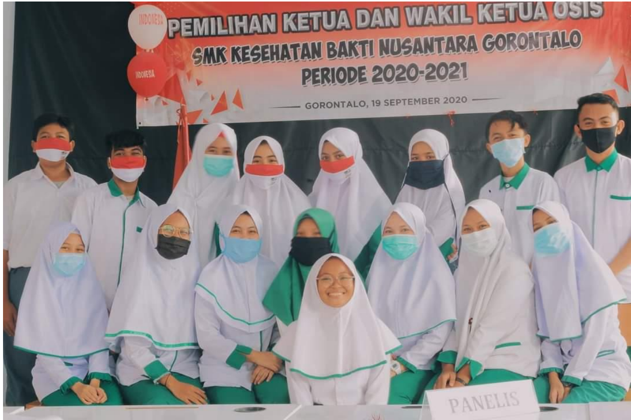
FOTO BERSAMA KETUA-KETUA ORGANISASI EKTRAKURIKULER (PANITIA PELAKSANA PEMILIHAN KEOTS 2020) DENGAN KETUA DAN WAKIL KETUA OSIS TERPILIH 2020